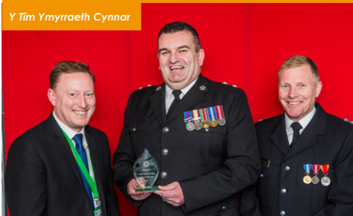
Y Tîm Ymyrraeth Cynnar